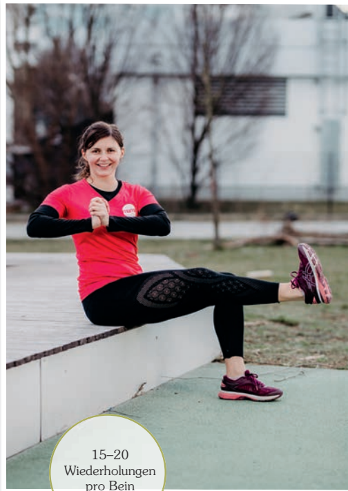
15-20 Wiederholungen pro Bein